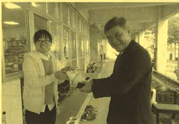
船浦中学校の生徒が集めた募金を担当の先生よりいただきました。