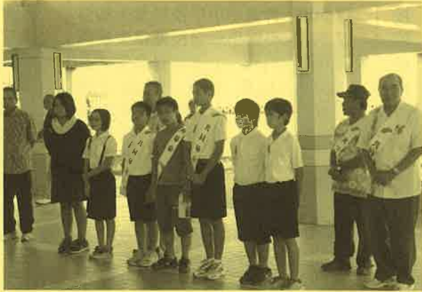
平成25年10月1日 大原小学校の児童と地域の方々と出発式を行いました。