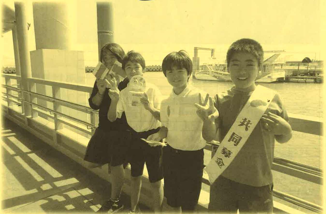
※大原小学校の児童による赤い羽根街頭募金のようす