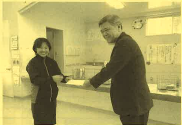
西表島小中学校児童生徒より募金をいただきました。