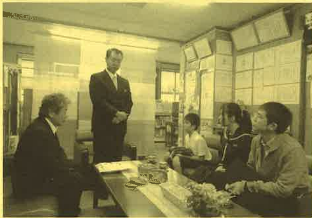
竹富小中学校の児童生徒が町役場を訪れ、集めた募金を町長に贈呈していただきました。