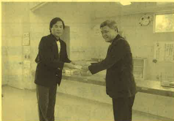
西表島小中学校職員より募金をいただきました。