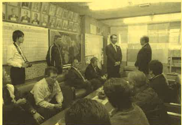
竹富町商工会建設業部会の皆様より募金をいただきました。