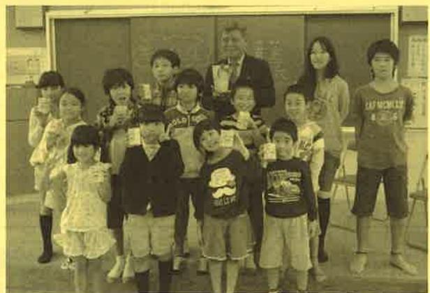
贈呈式 白浜小学校「竹富町で困っている人のために使って下さい」と募金をいただきました。子供達の頑張り伝わってきました。