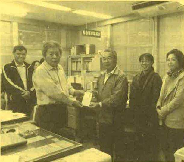
八重山古典民謡保存会 大浜修研究所