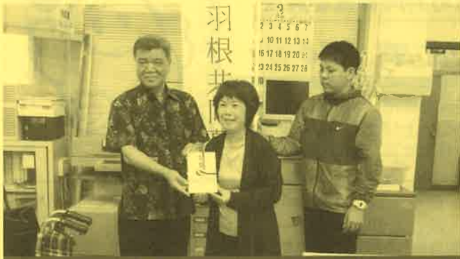
ヤマネコ文庫(西表東部地区)助成額 17万5千円

平成26年度より赤い羽根共同募金配分金の一部を財源として『住み慣れた地域で安心して暮らせるまちづくり』の推進に取り組む団体・グループ等に対して助成を行っております。平成26年度は以下の団体に助成が決定し、住民主体の「結のまちづくり活動」が展開されております。