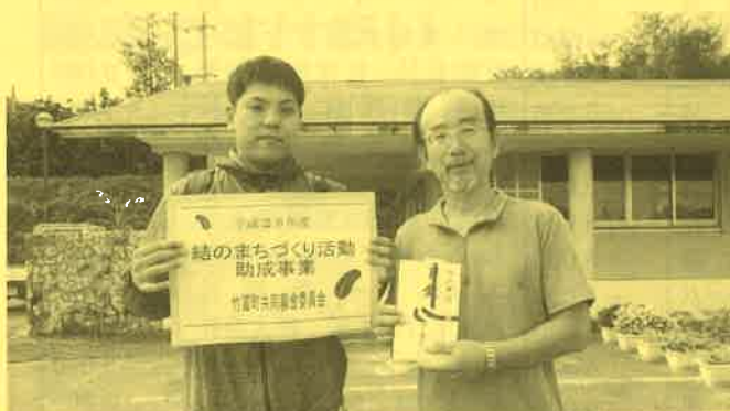
船浦ときめき秋祭り(船浦公民館)助成額17万5千円

子どもからお年寄りまで、地域住民でグランドゴルフ会を月に1回程度開催し、地域ふれあい交流の場づくりと健康づくりの推進を行います。