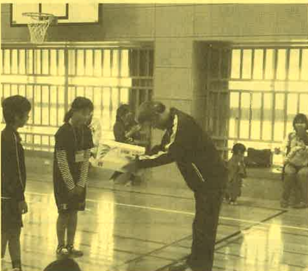
一生懸命あつめてくれた募金、大切に活用しますね (小浜小)