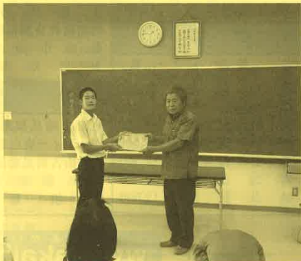
みなさんのあたたかい気持ち、伝わってきました。(船浮小)