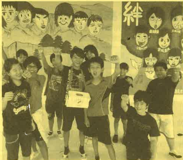
元気いっぱい募金活動をしてくださいました。(大原小)