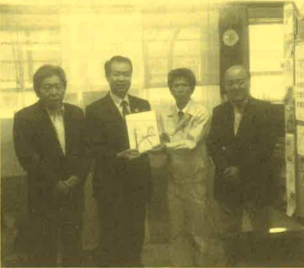
竹富町商工会建設業部会の皆様よりご寄付をいただきました