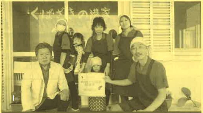
グランドゴルフ会(細崎公民館)助成額 10万円

1990年に「夢のある子！本の好きな子に」という趣旨で西表島東部地区の有志により竹富町旧大富保健指導所を改造して子ども文庫として開設されました。賛同するお母さんボランティアで運営され25周年を迎えます。本がかなり古くなり、汚れ等も目立ってきたことから、新しい本へ入れ替えを行い、親子で読書を楽しんでもらう場所づくりを推進します。