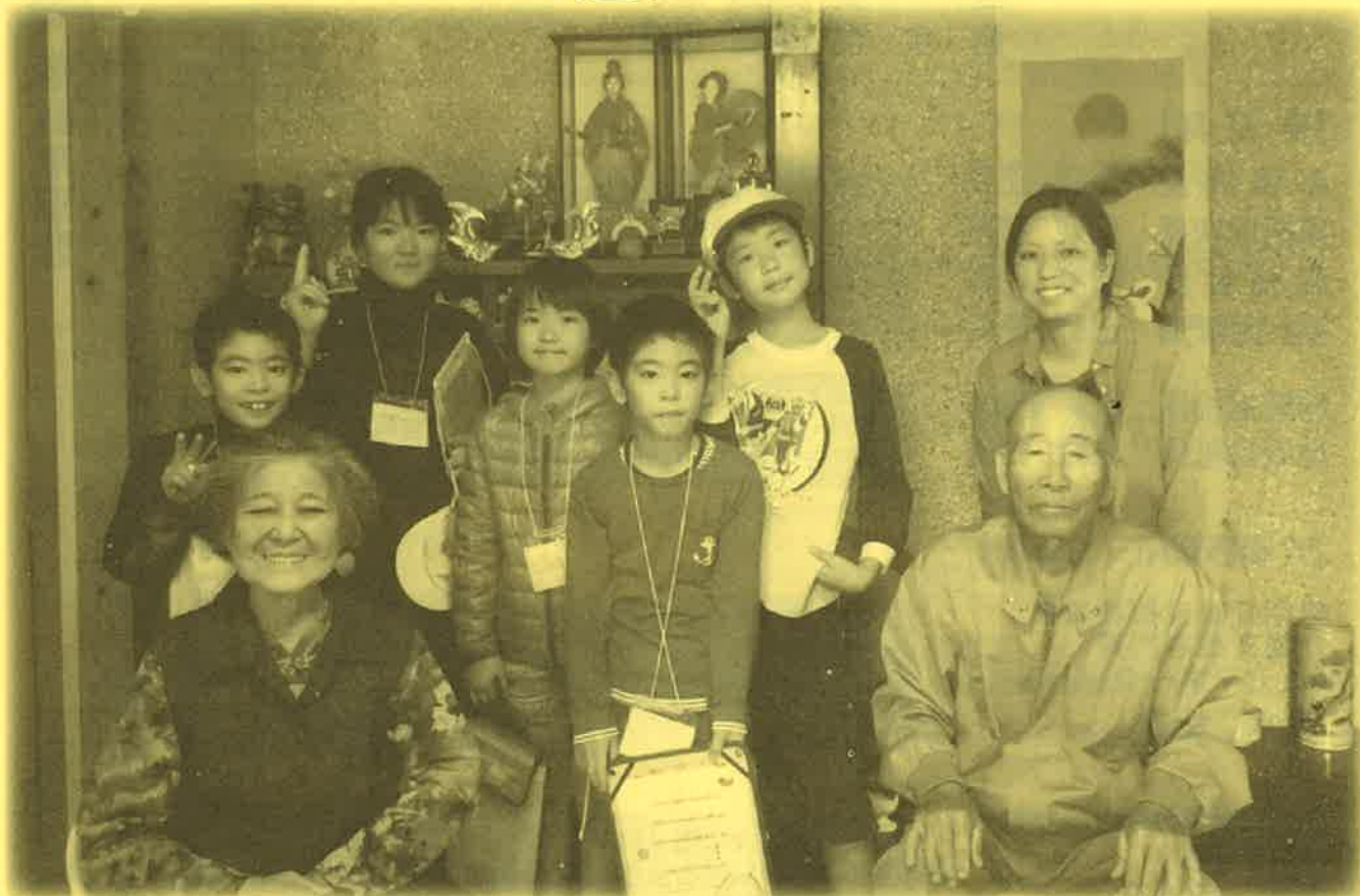
平成 27 年 2 月 20 日 波照間小学校 福祉教室