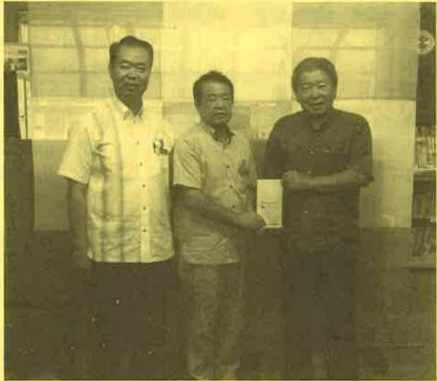
玉盛商会・東部交通・西表観光センターよりご寄付をいただきました