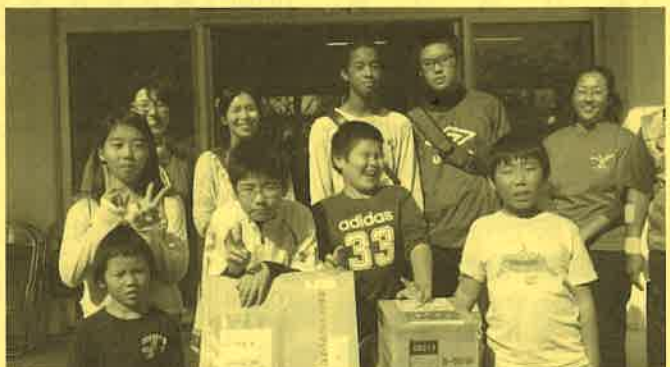
鳩間島 元気に過ごそう交流会(鳩間公民館)助成額11万円

地域住民の老若男女が楽しく集える祭りをを行う予定です。グランドゴルフ大会や料理教室、伝統舞踊、ダンス、歌、カラオケ大会など楽しく多彩なイベントを行い、地域住民のふれあい交流を基盤とした地域活性化を目指します。