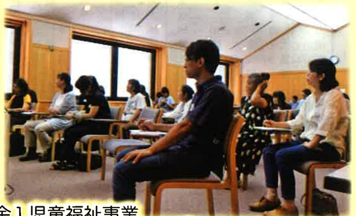
[ 赤い羽根共同募金 ] 児童福祉事業