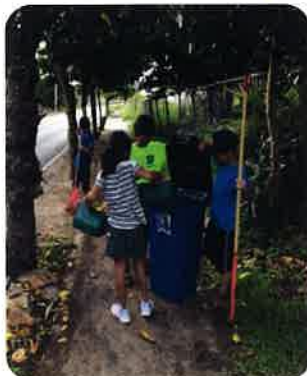
ボランティア活動支援