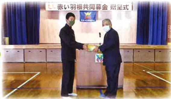
1月14日 大原中学校 166,114円

「世の中はコロナで大変な状況ですが、建設部会は頑張っています。」 500,000円