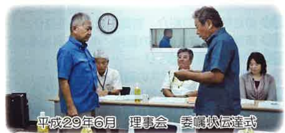
平成29年6月 理事会 委嘱状伝達式