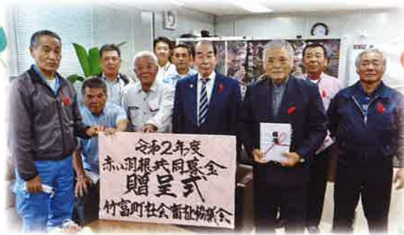
12月11日 竹富町商工会建設業部会

「今年は去年より多くの募金が集まりました。より多くの方に役立ち支えになって欲しいと思います。」