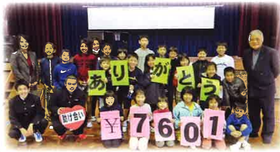
1月18日 西表小中学校 7,792円

「地域の人にも協力して頂きました。大切に使用してください。よろしくお願いします。」