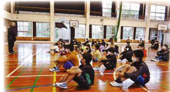
1月21日 波照間小中学校 25,286円

「沢山の皆様が賛同し資金を集めていただきました。今年は7,601円の募金額が集まることが出来ました。ありがとうございました。」