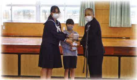
12月7日 小浜小中学校 18,919円

「今年は去年より多くの募金が集まりました。より多くの方に役立ち支えになって欲しいと思います。」