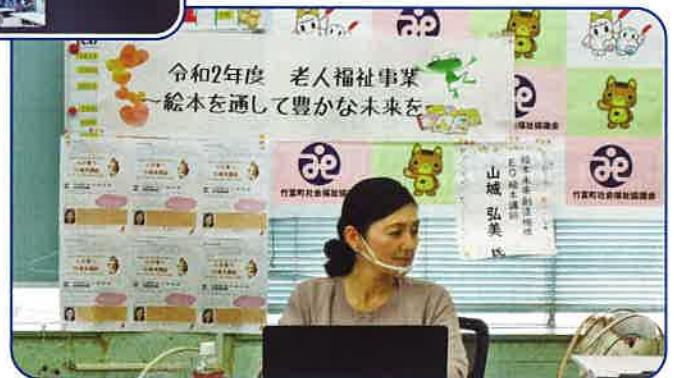
～ 竹富、西表西部東部、波照間(当日船便欠航のためリモート開催)で講話を行いました。～