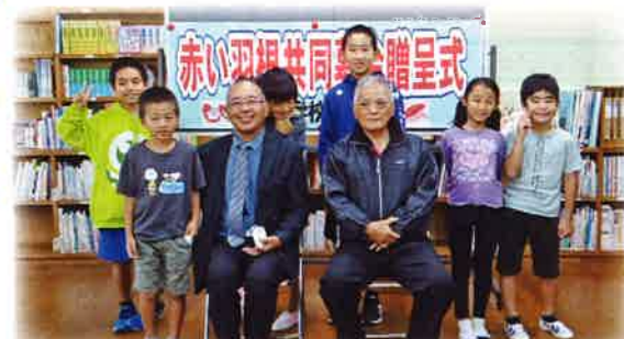
3月10日 古見小学校 17,159円

「今年度は各家庭の募金だけではなく、6か所に小学1・2年生が作った募金箱を置かせていただきました。今日は本当にありがとうございました。」