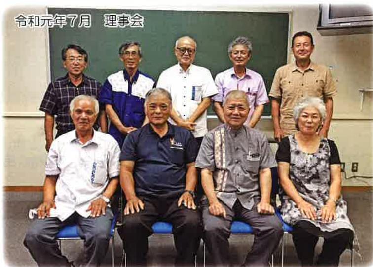
令和元年7月 理事会