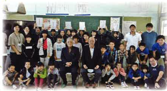
2月22日 竹富小中学校 112,077円

「自分なりの幸せのために(募金を)やってほしいなと思います。ありがとうございました。」