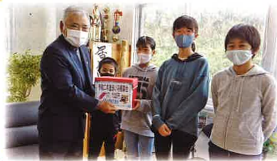
1月18日 上原小学校 19,914円

「去年が68,830円でしたので倍以上の募金が集まる事が出来ました。皆様のご協力ありがとうございました。」