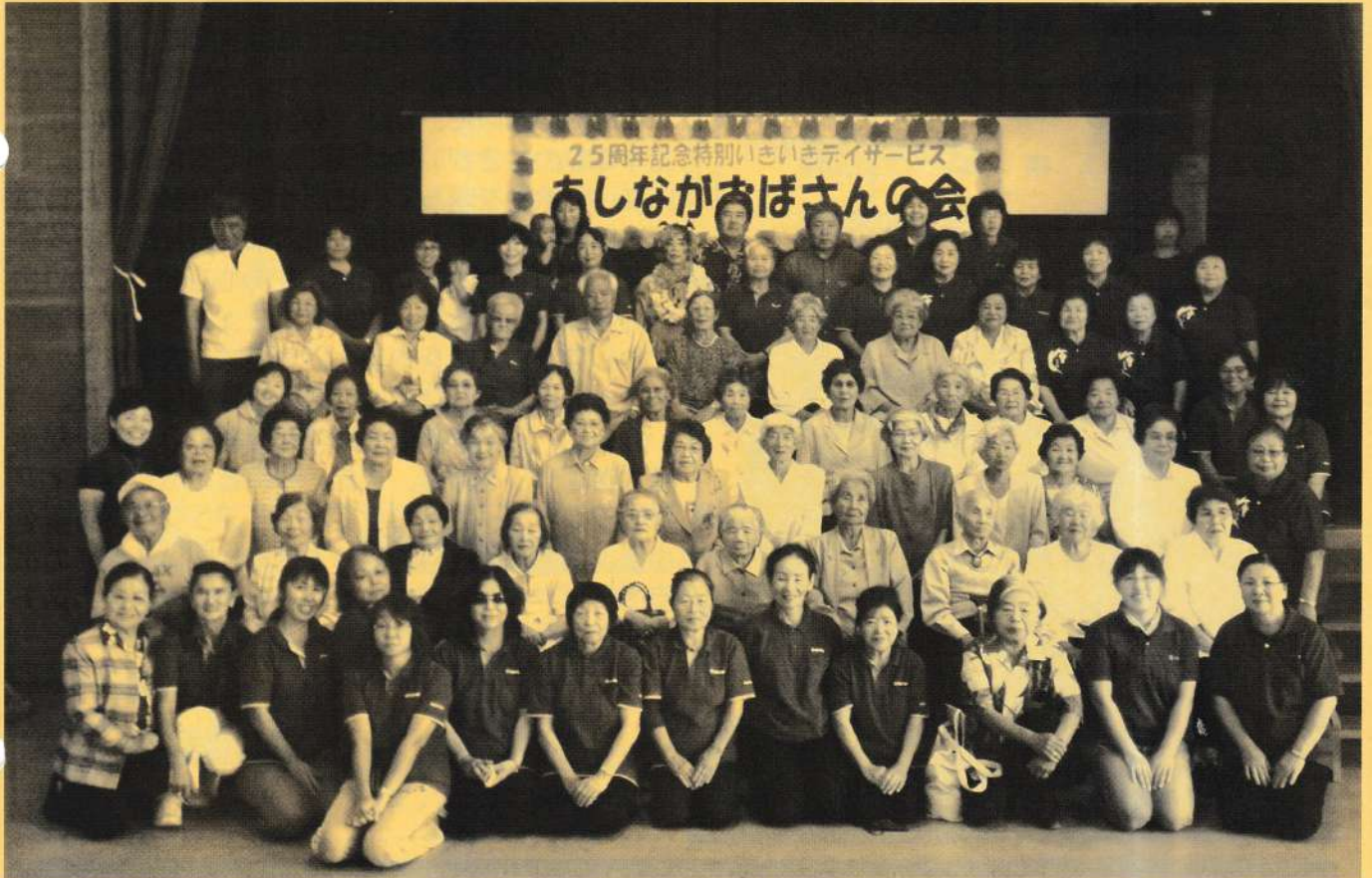
あしながおばさんの会 25周年記念特別いきいきデイサービス (平成24年10月24日 竹富町離島振興総合センターにて)

■西表東部地区のお年寄りがつどい、あしながおばさんの会のボランティアや他の地区のボランティアも招待して、一緒にあしながおばさんの会の25周年を祝いました。(2頁に関連記事)