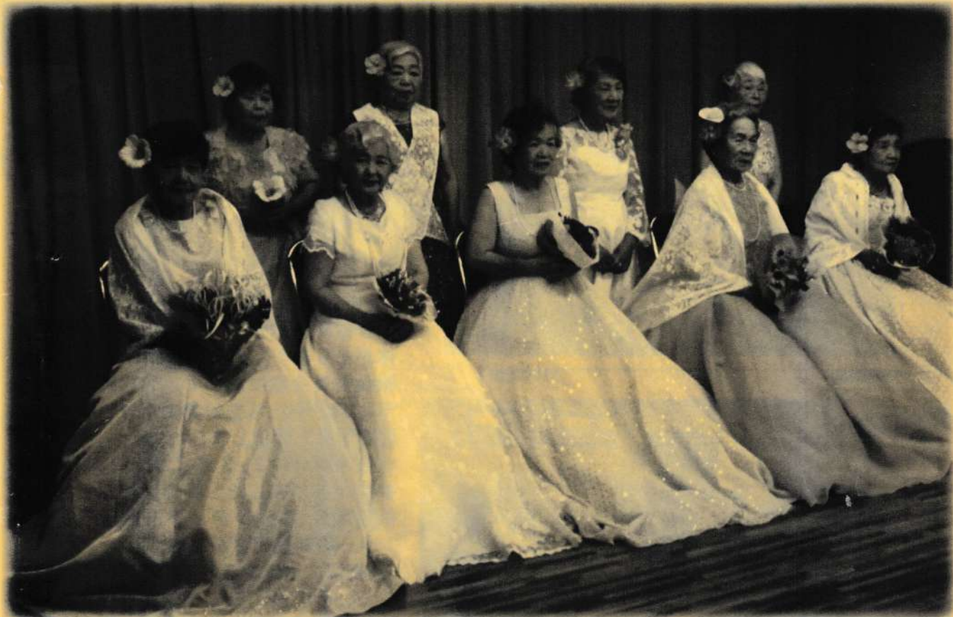
H25.6.11【竹富】ほほえみの会：ウエディングドレス撮影会