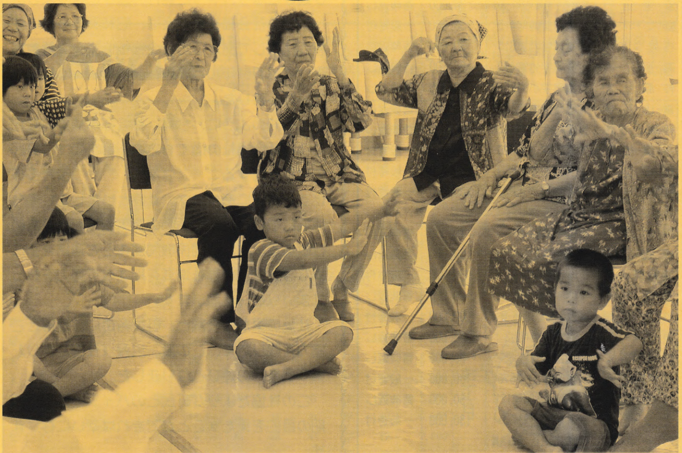
ミニデイサービス・寿会

■黒島地区のお年寄りがつどい、寿会のボランティア・黒島保育所の子供達といっしょに楽しいひとときをすごして交流を深めました。