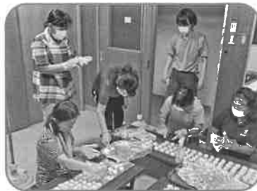
小浜婦人会 (助成額:35,000円) 手作りコキブリ団子の配布