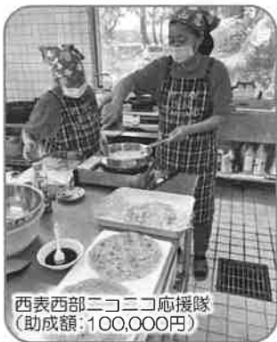
西表西部ニコニコ応援隊 (助成額:100,000円)