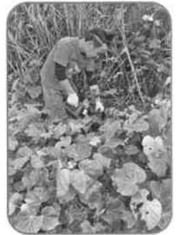
細崎青年会 (助成額:63,000円) 細崎を美しい地域にする会