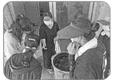
織・藍好会 (助成額:88,000円) 藍建てを学ぶ