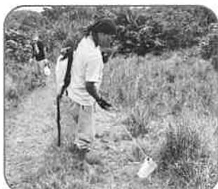
鳩間公民館 (助成額:80,000円) 島内雑草除去チーム