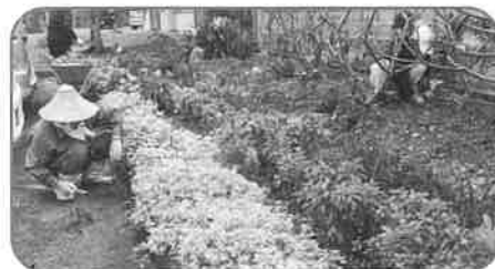
上原老人クラブ (助成額:35,000円) 花いっぱい運動の拡充 子ども会(年少児童)と共に