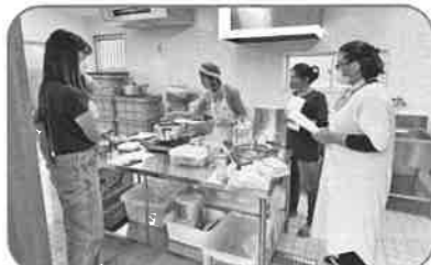
五感を育む会 (助成額:16,000円) 有用島植物利用活用プロジェクト