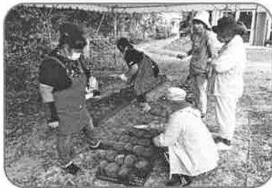
大原婦人会 (助成額:33,344円) 花で華やかな大原集落