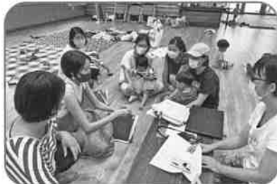
小浜島ふあま会 (助成額:12,000円) 乳幼児と親の居場所づくり