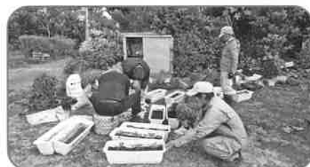
祖納老人クラブ (助成額:100,000円) 花いっぱいの地域作り