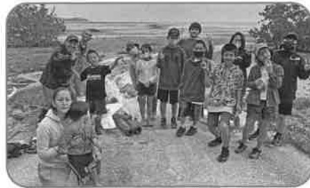
古見・美原子ども会育成会 (助成額:20,924円) ビーチクリーン活動と環境学習