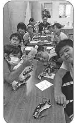
鳩間子ども会育成会 (助成額:88,000円) 鳩間方言で カルタ大会・カルタ作り