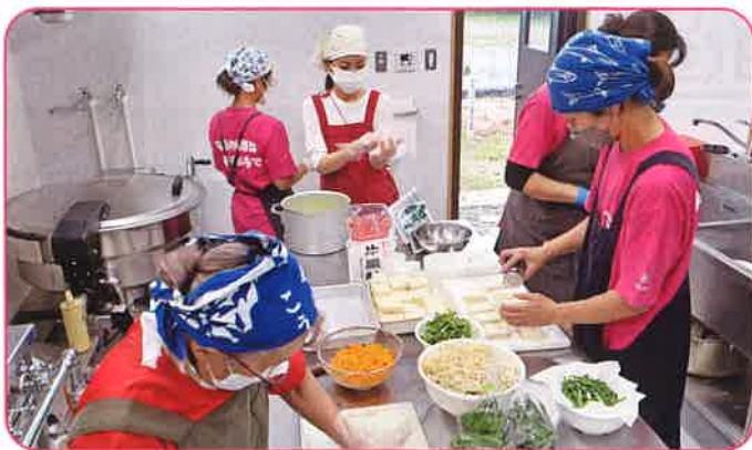
竹富地区食生活改善推進協議会 助成額：55,000円 健康寿命を目指して（講話・弁当配布等）