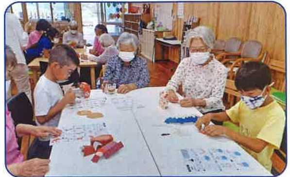
大原小学校とあしながおばさんの会 (西表島東部) ふれあい交流 (R5.2.13)

理解を深める事で子ども達が高齢者に対して自分から積極的に関わりをもつ場面が見られ、関係づくりのよいきっかけになりました。