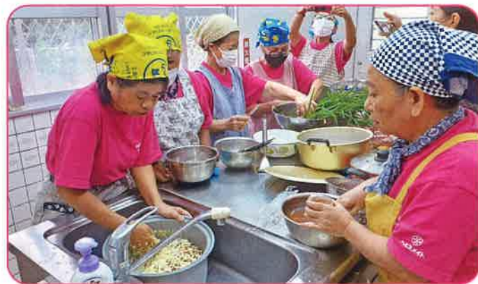
波照間地区食生活改善推進協議会 助成額：27,000円 ハーブ（野草）を利用した健康促進事業