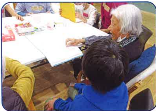
竹富小学校とまーまーず (竹富) ふれあい交流 (R5.3.9)