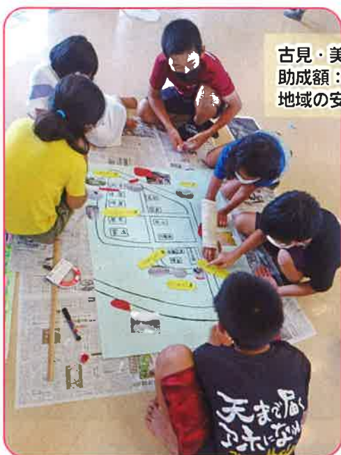
古見・美原子ども会育成会 助成額：31,000円 地域の安全と魅力を再発見