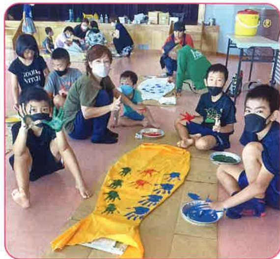
豊原子ども会 助成額：30,000円 こいのぼり作り