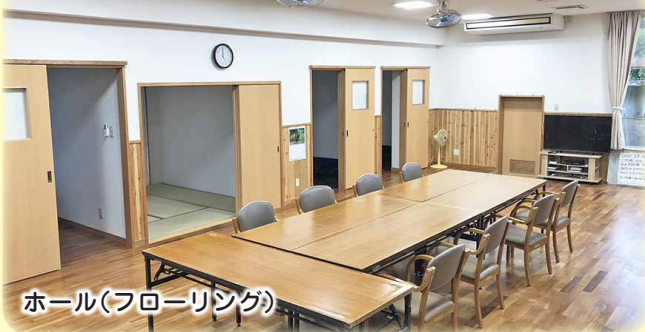
ホール(フローリング)